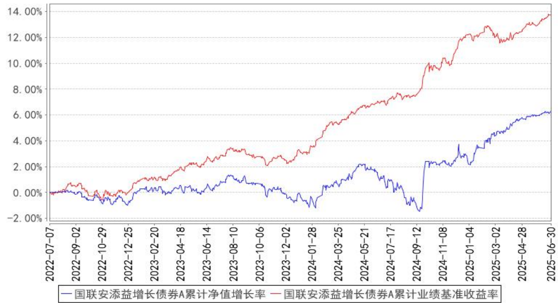
国联安添益增长债券A累计净值增长率与同期业绩比较基准收益率的历史走势对比图

注：1、本基金业绩比较基准为中债新综合财富指数收益率*90%+沪深 300 指数收益率*8%+中证港股通综合指数(人民币)收益率*2%； 2、本基金基金合同于 2022 年 7 月 7 日生效； 3、本基金建仓期为自基金合同生效之日起的 6 个月，建仓期结束时各项资产配置符合合同约定。