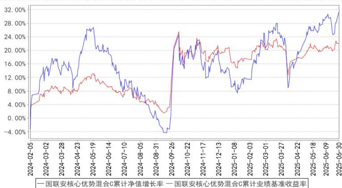
国联安核心优势混合C累计净值增长率与同期业绩比较基准收益率的历史走势对比图

注：1、国联安核心优势混合型证券投资基金于 2023 年 12 月 5 日起增加收取销售服务费的 C 类基金份额，并对本基金基金合同及托管协议作相应修改，原有的基金份额在增加收取销售服务费的 C 类基金份额后，全部转换为国联安核心优势混合型证券投资基金 A 类份额；