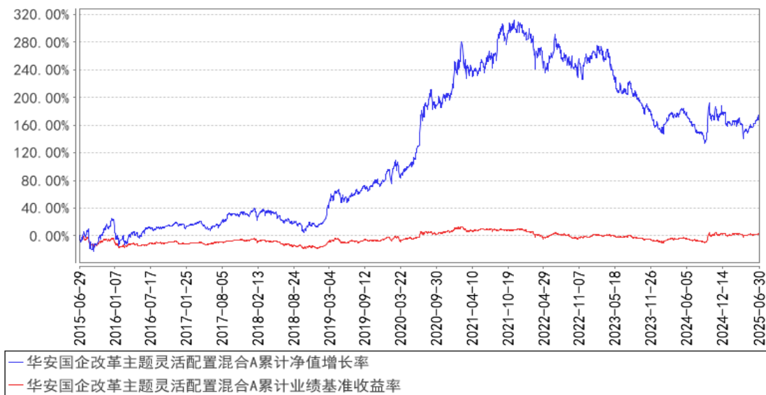
华安国企改革主题灵活配置混合A累计净值增长率与同期业绩比较基准收益率的历史走势对比图