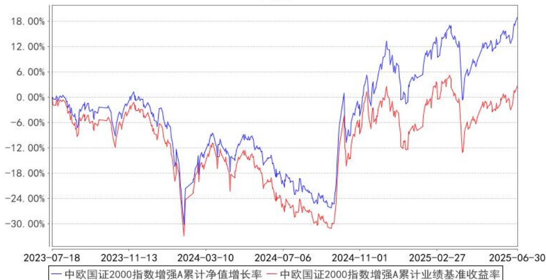
中欧国证2000指数增强A累计净值增长率与同期业绩比较基准收益率的历史走势对比图