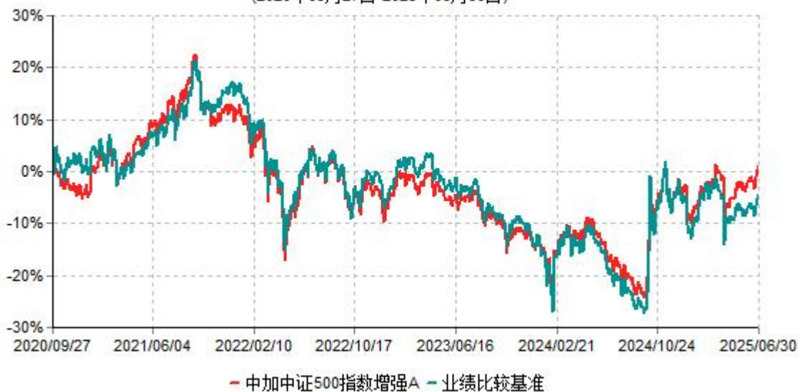
中加中证500指数增强A累计净值增长率与业绩比较基准收益率历史走势对比图 (2020年09月27日-2025年06月30日)