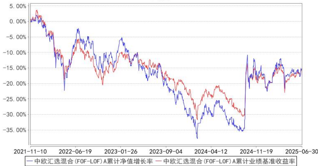
中欧汇选混合 (FOF-LOF) A 累计净值增长率与同期业绩比较基准收益率的历史走势对比图

注：2023 年 5 月 5 日起组合业绩比较基准变更为中证偏股型基金指数收益率×80%+银行活期存款利率(税后)×20%。