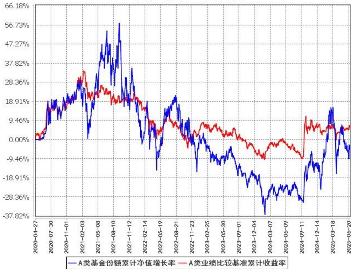
A类基金份额累计净值增长率与同期业绩比较基准收益率的历史走势对比图 (2020年4月27日至2025年6月30日)