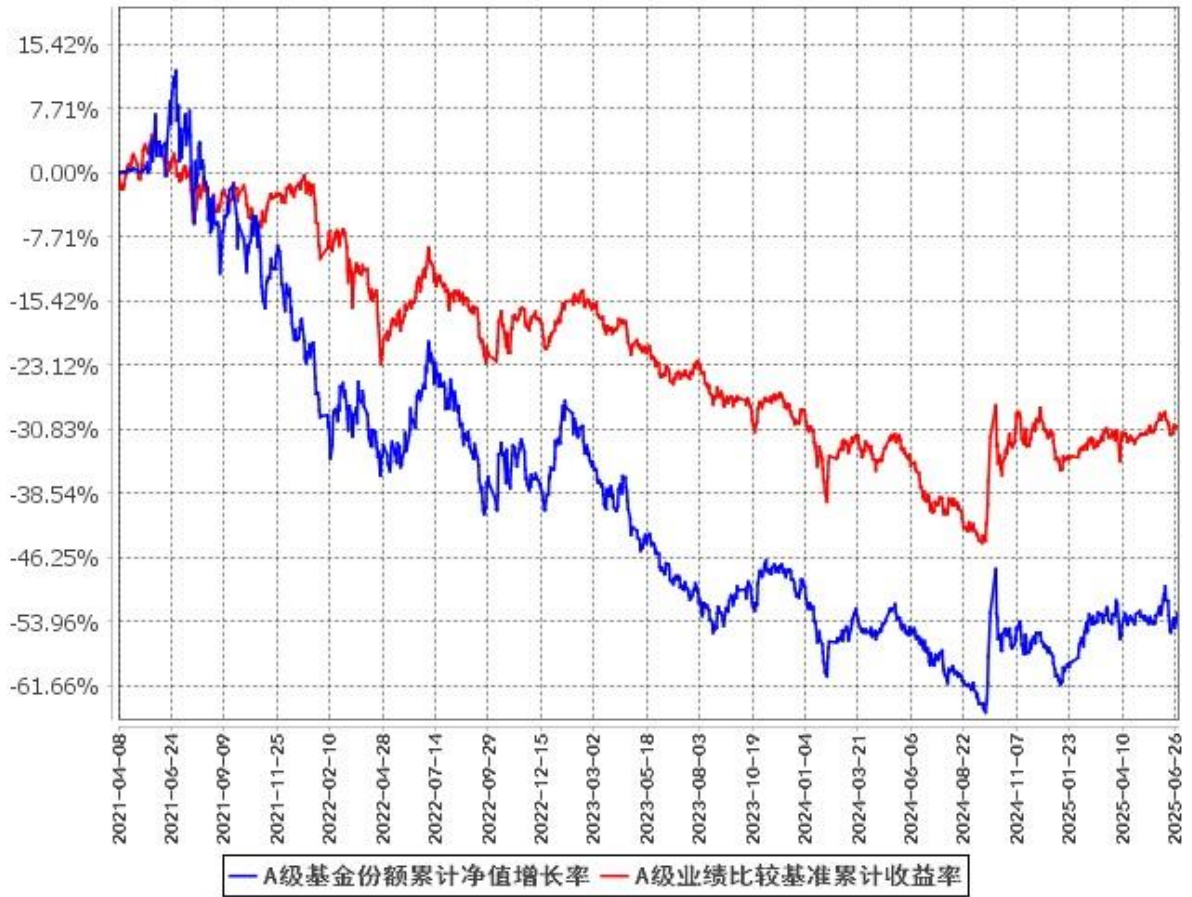
A级基金份额累计净值增长率与同期业绩比较基准收益率的历史走势对比图 (2021年4月8日至2025年6月30日)