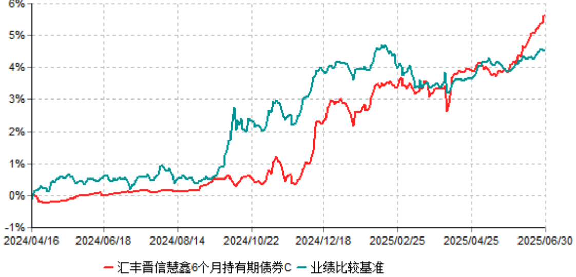
汇丰晋信慧鑫6个月持有期债券C累计净值增长率与业绩比较基准收益率历史走势对比图 (2024年04月16日-2025年06月30日)