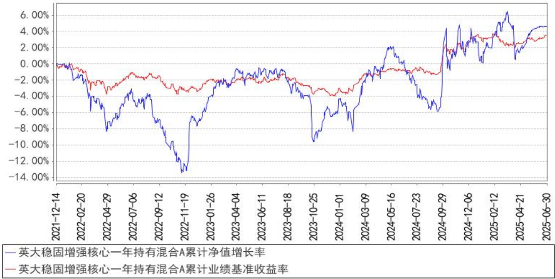
英大稳固增强核心一年持有混合A累计净值增长率与同期业绩比较基准收益率的历史走势对比图

注：同期业绩比较基准为沪深 300 指数收益率×15%+中债综合指数收益率×85%。