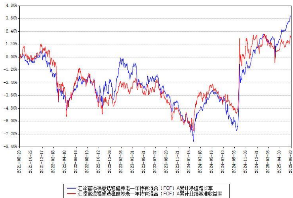
汇添富添福睿选稳健养老一年持有混合（FOF）A累计净值增长率与同期业绩基准收益率对比图