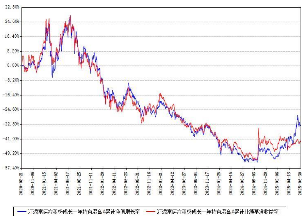
汇添富医疗积极成长一年持有混合A累计净值增长率与同期业绩基准收益率对比图