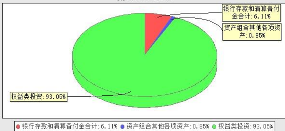
华宝核心优势灵活配置混合型证券投资基金投资组合资产配置图表(数据截止日期: 20250630)