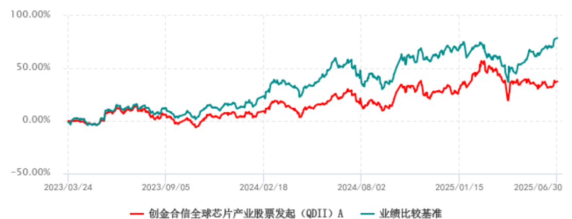
创金合信全球芯片产业股票发起（QDII）A累计净值增长率与业绩比较基准收益率 历史走势对比图 (2023年03月24日-2025年06月30日)