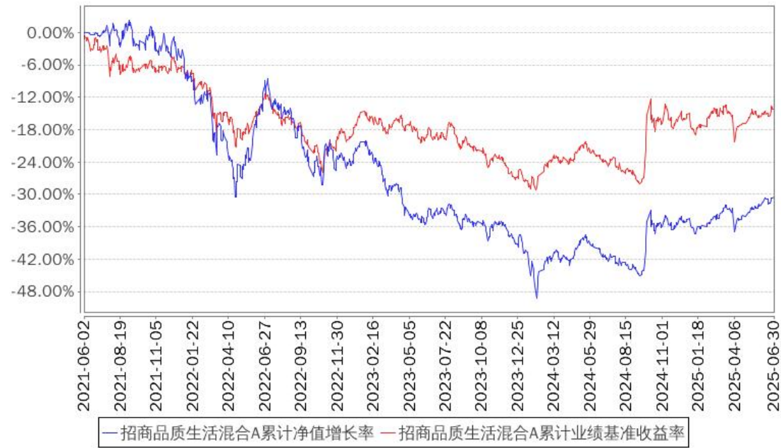
招商品质生活混合A累计净值增长率与同期业绩比较基准收益率的历史走势对比图