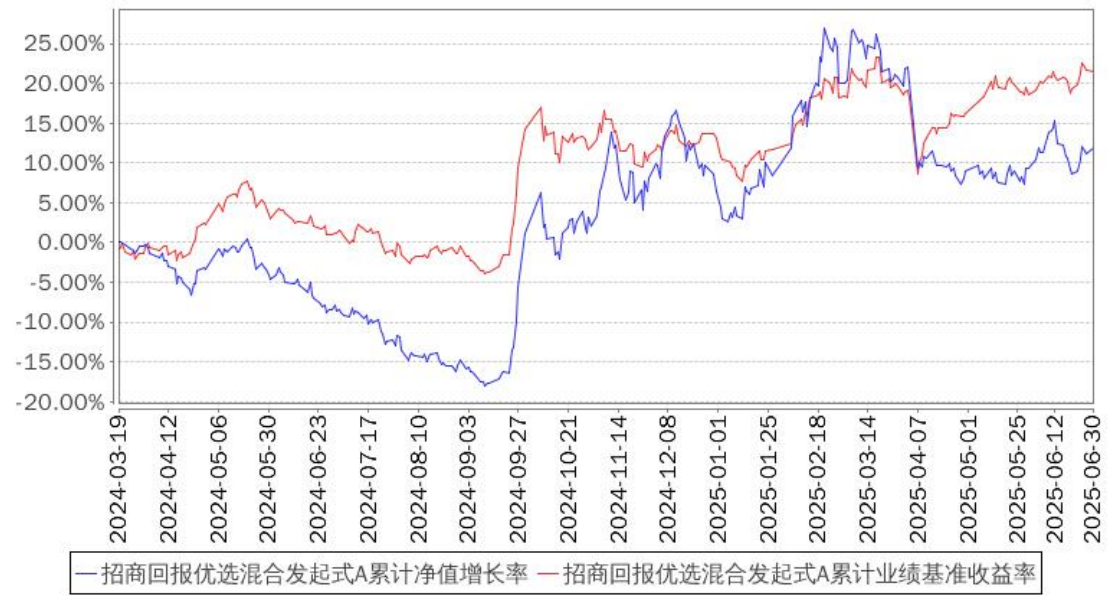
招商回报优选混合发起式A累计净值增长率与同期业绩比较基准收益率的历史走势对比图