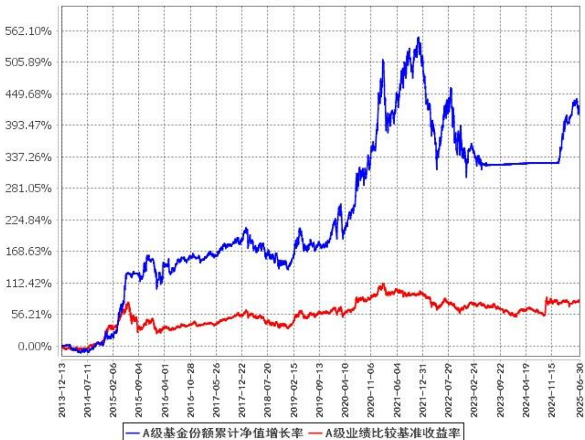
A级基金份额累计净值增长率与同期业绩比较基准收益率的历史走势对比图 (2013年12月13日至2025年6月30日)