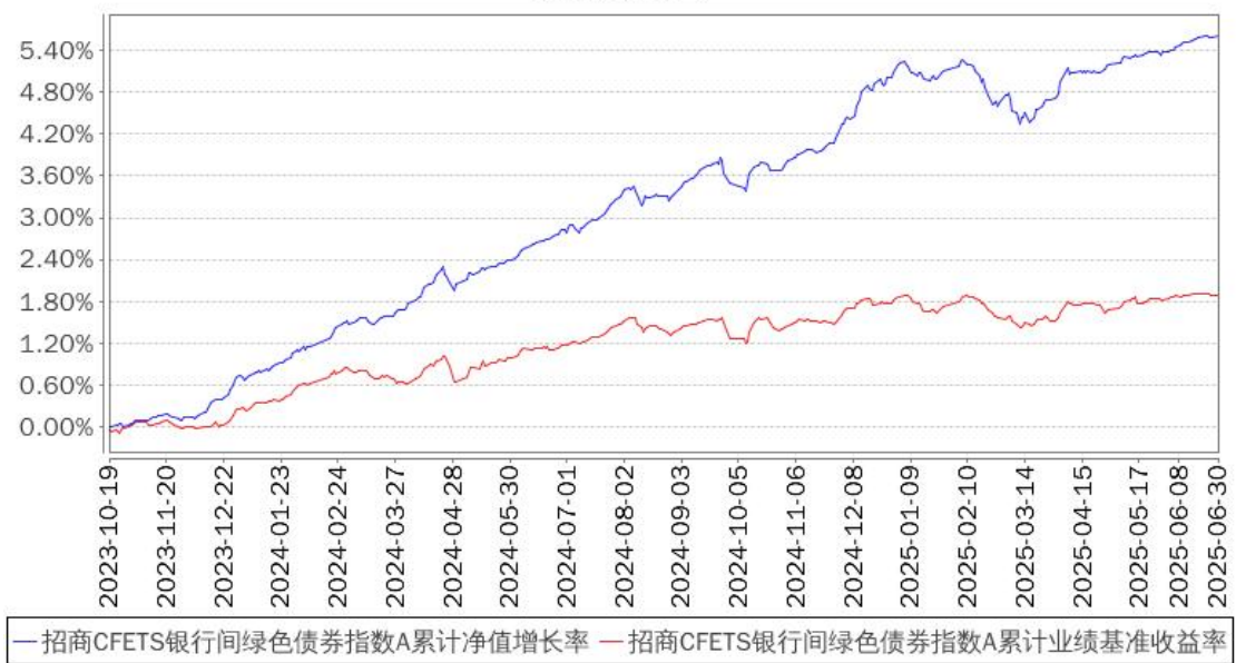
招商CFETS银行间绿色债券指数A累计净值增长率与同期业绩比较基准收益率的历史走势对比图