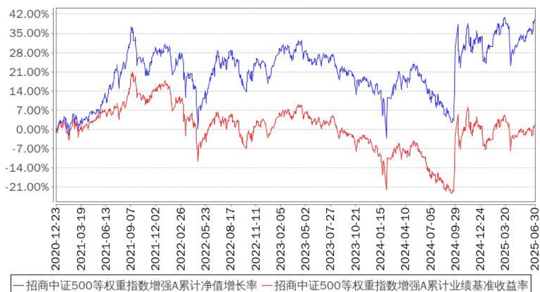
招商中证500等权重指数增强A累计净值增长率与同期业绩比较基准收益率的历史走势对比图