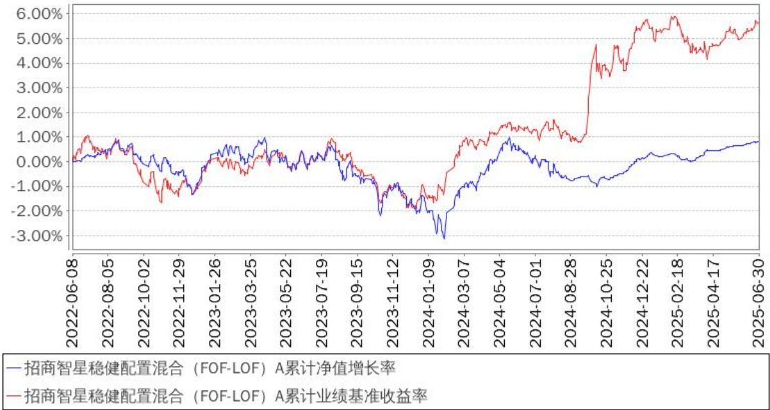
招商智星稳健配置混合（FOF-LOF）A累计净值增长率与同期业绩比较基准收益率的历史走势对比图