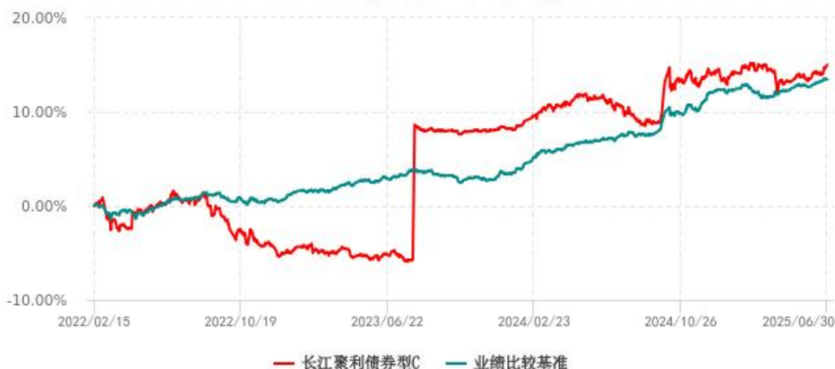
长江聚利债券型C累计净值增长率与业绩比较基准收益率历史走势对比图 (2022年02月15日-2025年06月30日)

注：本基金 C 类份额“自基金合同生效以来”的报告期为 2022 年 02 月 15 日至 2025 年 06 月 30 日。