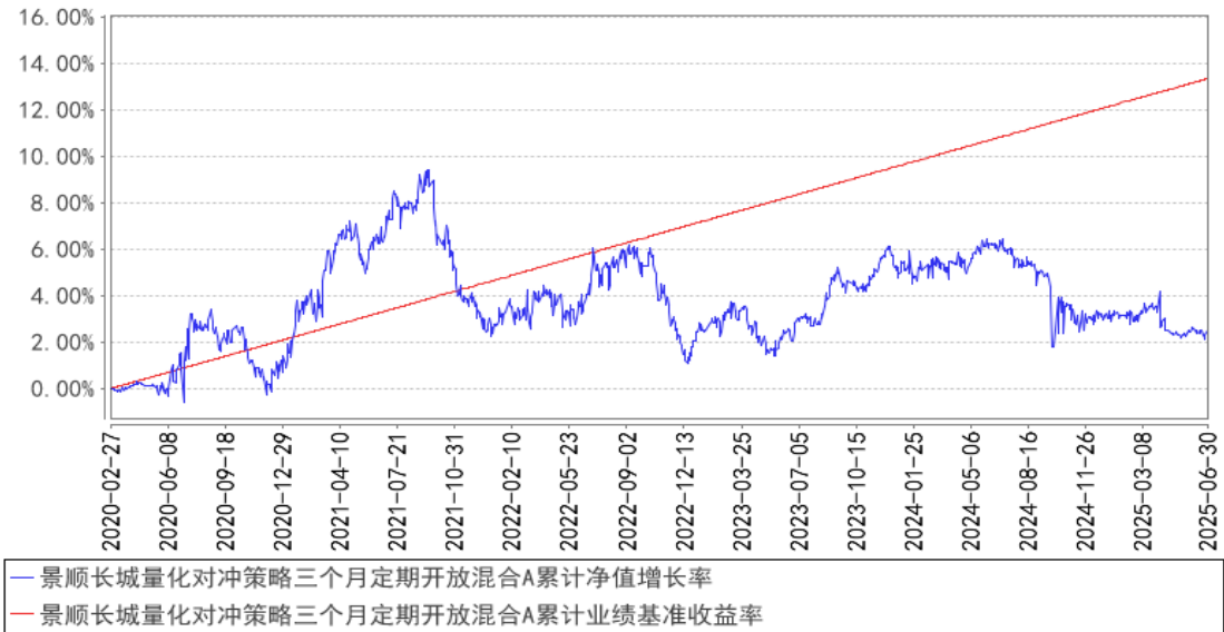
景顺长城量化对冲策略三个月定期开放混合A累计净值增长率与同期业绩比较基准收益率的历史走势对比图

注：本基金于 2025 年 02 月 12 日增设 C 类基金份额，并于 2025 年 02 月 17 日开始对 C 类份额进行估值。