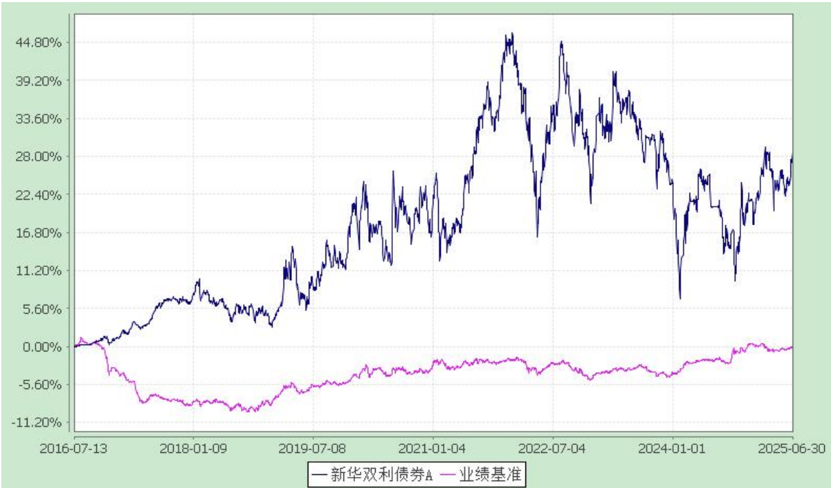
份额累计净值增长率与业绩比较基准收益率历史走势对比图 (2016 年 7 月 13 日至 2025 年 6 月 30 日)

注：本基金自 2024 年 8 月 23 日起增加 E 类基金份额（基金代码：021992），份额首次确认日为 2024 年 9 月 24 日，增设当期的相关数据和指标按实际存续期计算。