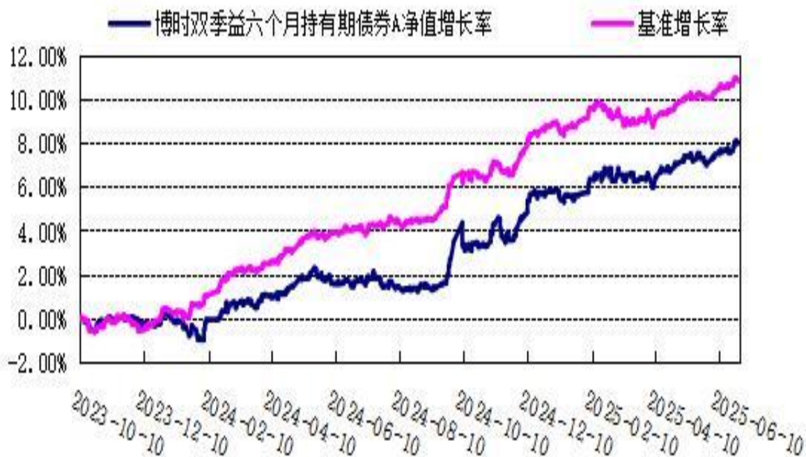
博时双季益六个月持有期债券 C