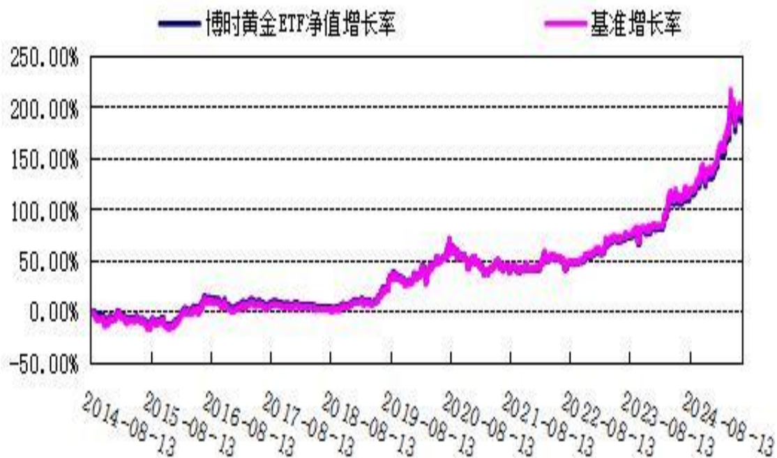
博时黄金 ETF 场外 D 类