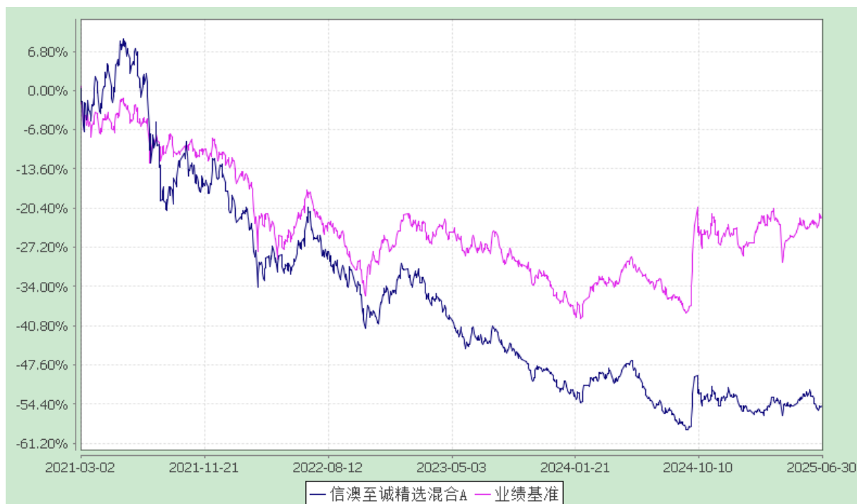
信澳至诚精选混合 C 累计净值增长率与业绩比较基准收益率的历史走势对比图