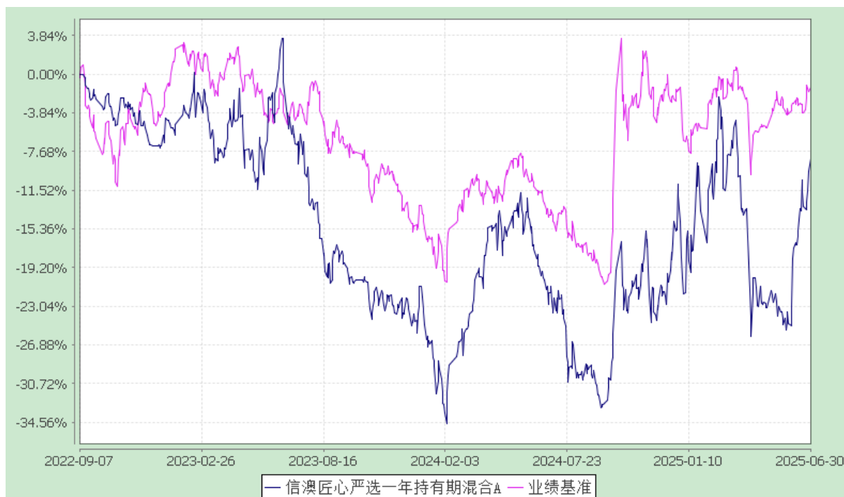
信澳匠心严选一年持有期混合 C 累计净值增长率与业绩比较基准收益率的历史走势对比图