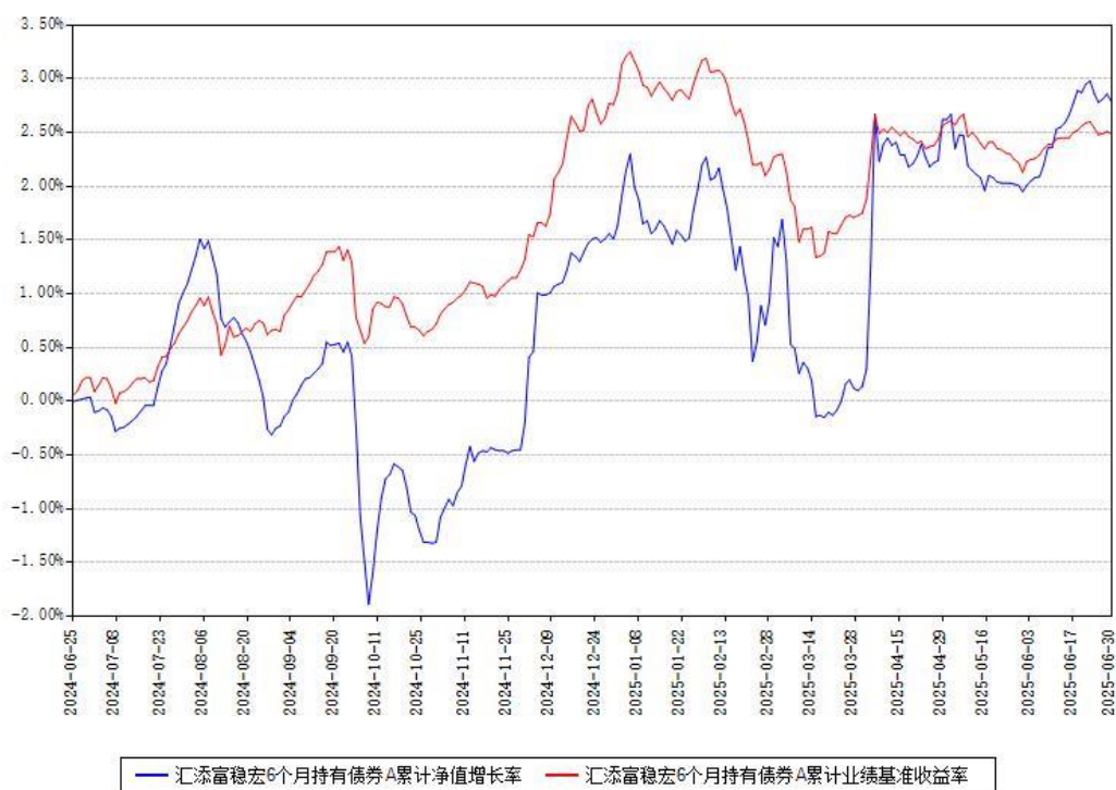
汇添富稳宏6个月持有债券A累计净值增长率与同期业绩基准收益率对比图