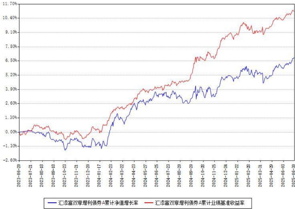
汇添富双享增利债券A累计净值增长率与同期业绩基准收益率对比图