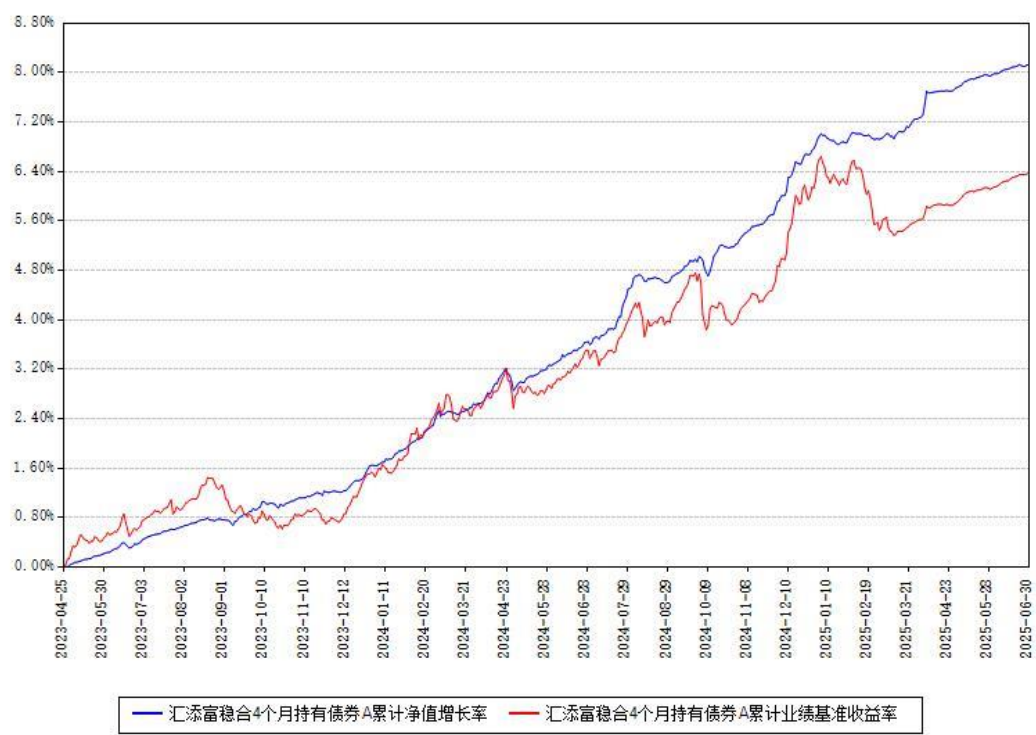
汇添富稳合4个月持有债券A累计净值增长率与同期业绩基准收益率对比图