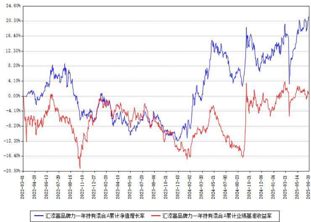
汇添富品牌力一年持有混合A累计净值增长率与同期业绩比较基准收益率对比图