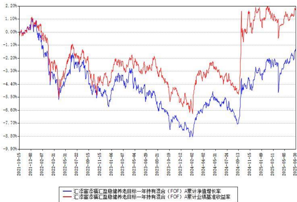
汇添富添福汇盈稳健养老目标一年持有混合（FOF）A 累计净值增长率与同期业绩比较基准收益率对比图