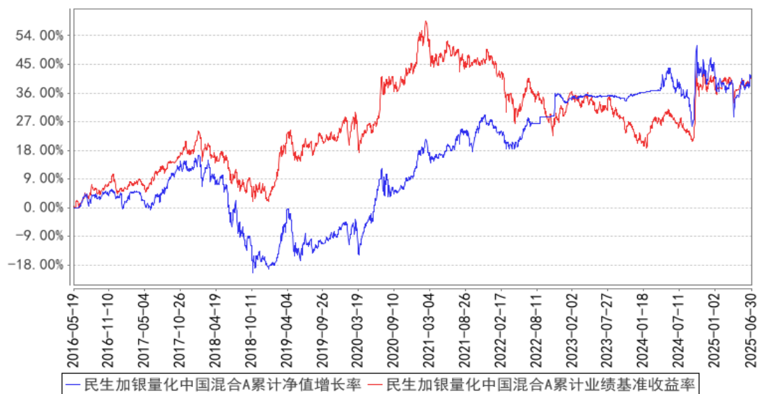
民生加银量化中国混合A累计净值增长率与同期业绩比较基准收益率的历史走势对比图