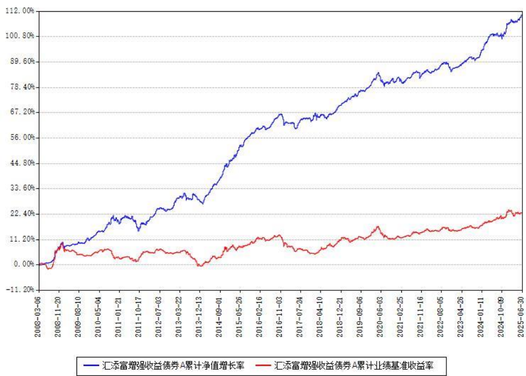
汇添富增强收益债券A累计净值增长率与同期业绩比较基准收益率对比图