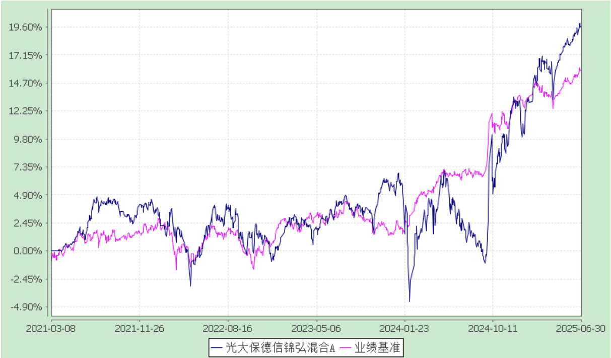
光大保德信锦弘混合 C