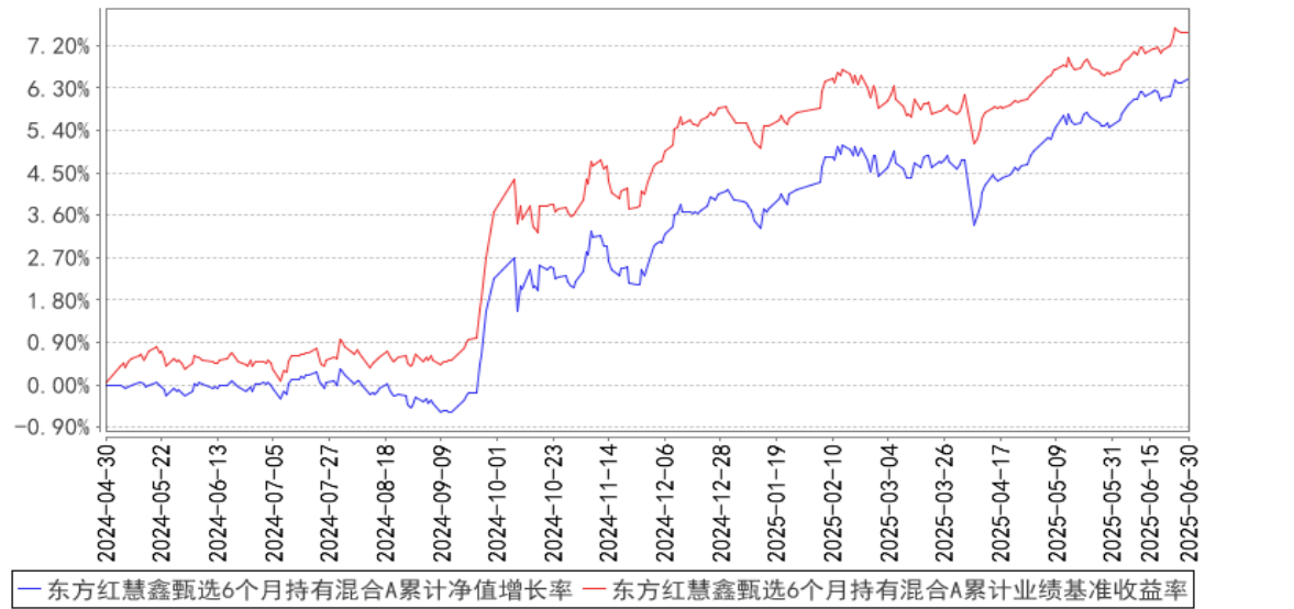
东方红慧鑫甄选6个月持有混合A累计净值增长率与同期业绩比较基准收益率的历史走势对比图

注：本基金的业绩比较基准为：中债新综合财富指数收益率×80%+中证 800 指数收益率×12%+恒生指数收益率（经汇率估值调整）×3%+银行活期存款利率（税后）×5%。本基金每个交易日对业绩比较基准根据设定的权重比例进行再平衡处理，并用每日连乘方式计算得到指数基准的时间序列。