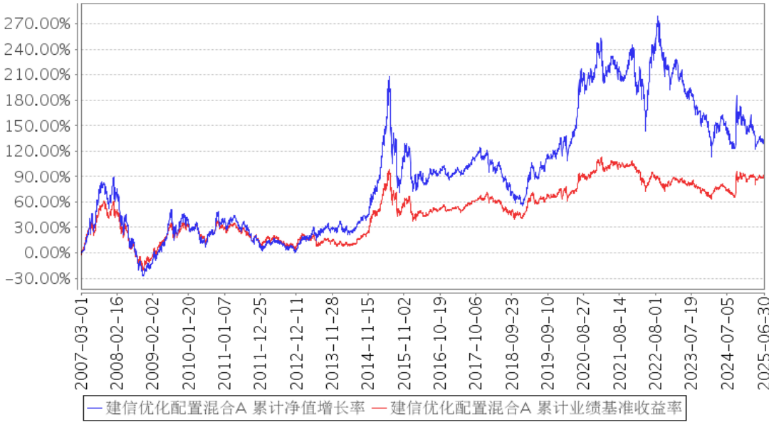
建信优化配置混合A 累计净值增长率与同期业绩比较基准收益率的历史走势对比图

注：本基金业绩比较基准： 60\% \times \text{富时中国 A600 指数} + 40\% \times \text{中国债券总指数} 。其中：富时中国 A600 指数收益率作为衡量股票投资部分的业绩基准，中国债券总指数收益率作为衡量基金债券投资部分的业绩基准。富时中国 A600 指数由新华富时指数公司发布，该指数包含中国深沪两个市场流通市值最大的六百家上市公司，涵盖了几乎所有行业。该指数在市场代表性、市场相关度、流动性等方面具备作为基准指数的可行性。中债系列指数由一个总指数（即中国债券总指数），若干个分指数构成。中国债券总指数是全样本债券指数，包括市场上所有具有可比性的符合指数编制标准的债券（如交易所和银行间国债、银行间金融债券等），理论上能客观反映中国债券总体情况。