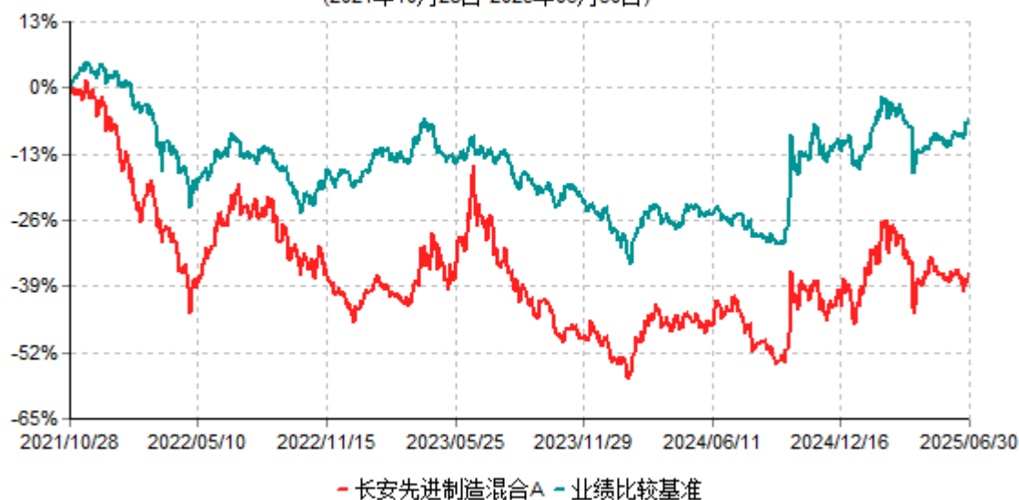
长安先进制造混合A累计净值增长率与业绩比较基准收益率历史走势对比图 (2021年10月28日-2025年06月30日)

根据基金合同的规定,自基金合同生效之日起6个月内基金各项资产配置比例需符合基金合同要求。本基金在建仓期结束后,各项资产配置比例已符合基金合同有关投资比例的约定。基金合同生效日至报告期期末,本基金运作时间超过一年。图示日期为2021年10月28日至2025年6月30日。