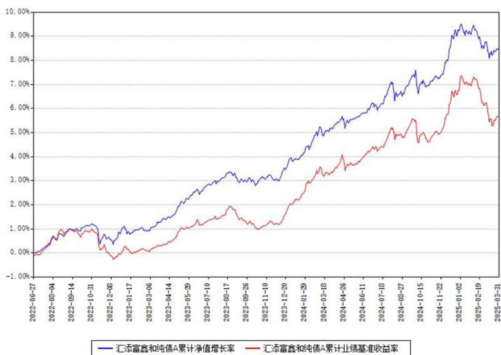
汇添富鑫和纯债A累计净值增长率与同期业绩基准收益率对比图

(二)自基金合同生效以来基金累计净值增长率变动及其与同期业绩比较基准收益率变动的比较图