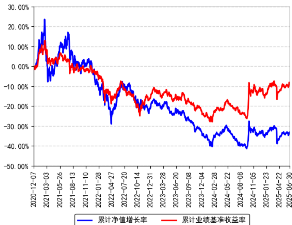
南方产业升级混合A累计净值增长率与同期业绩比较基准收益率的历史走势对比图