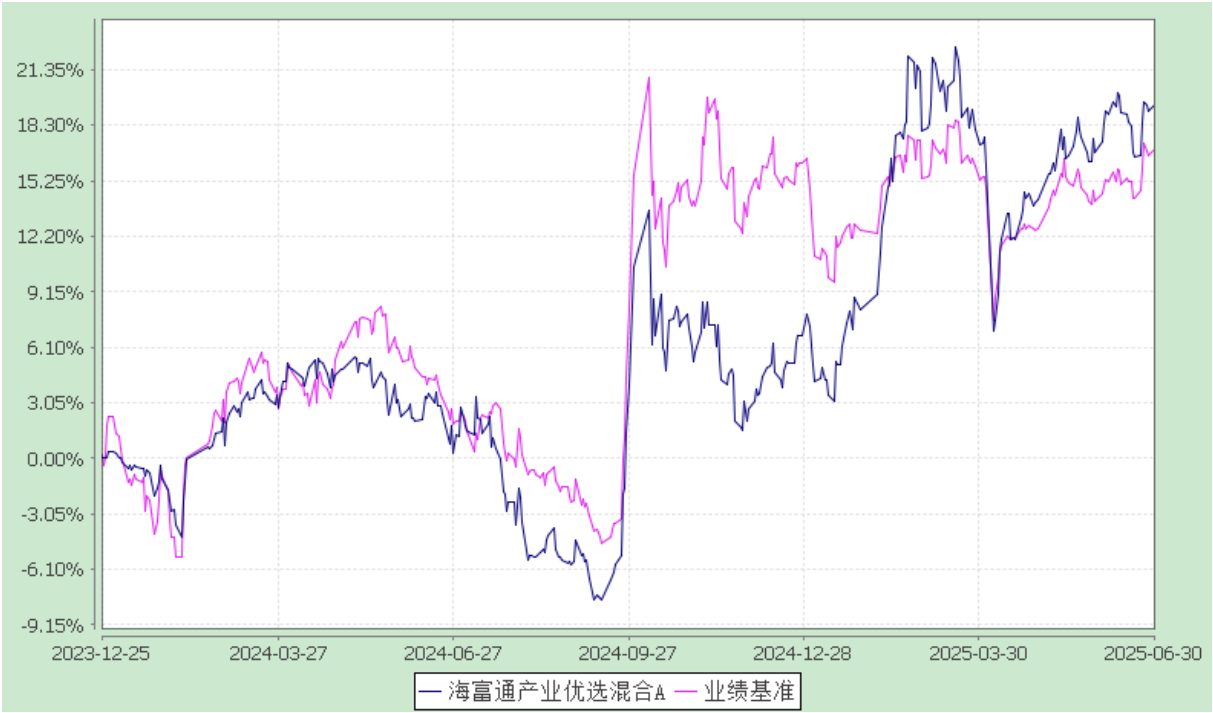
海富通产业优选混合 C