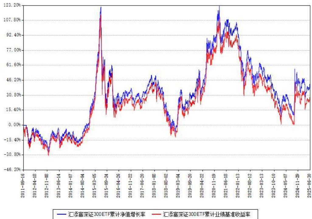
汇添富深证300ETF累计净值增长率与同期业绩基准收益率对比图