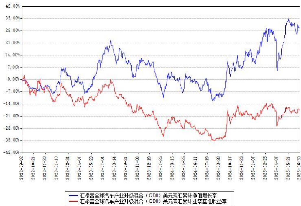
汇添富全球汽车产业升级混合（QDII）美元现钞累计净值增长率与同期业绩基准收益率对比图