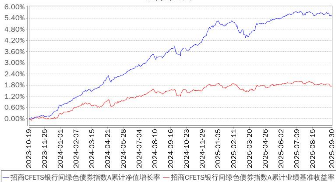
招商CFETS银行间绿色债券指数A累计净值增长率与同期业绩比较基准收益率的历史走势对比图