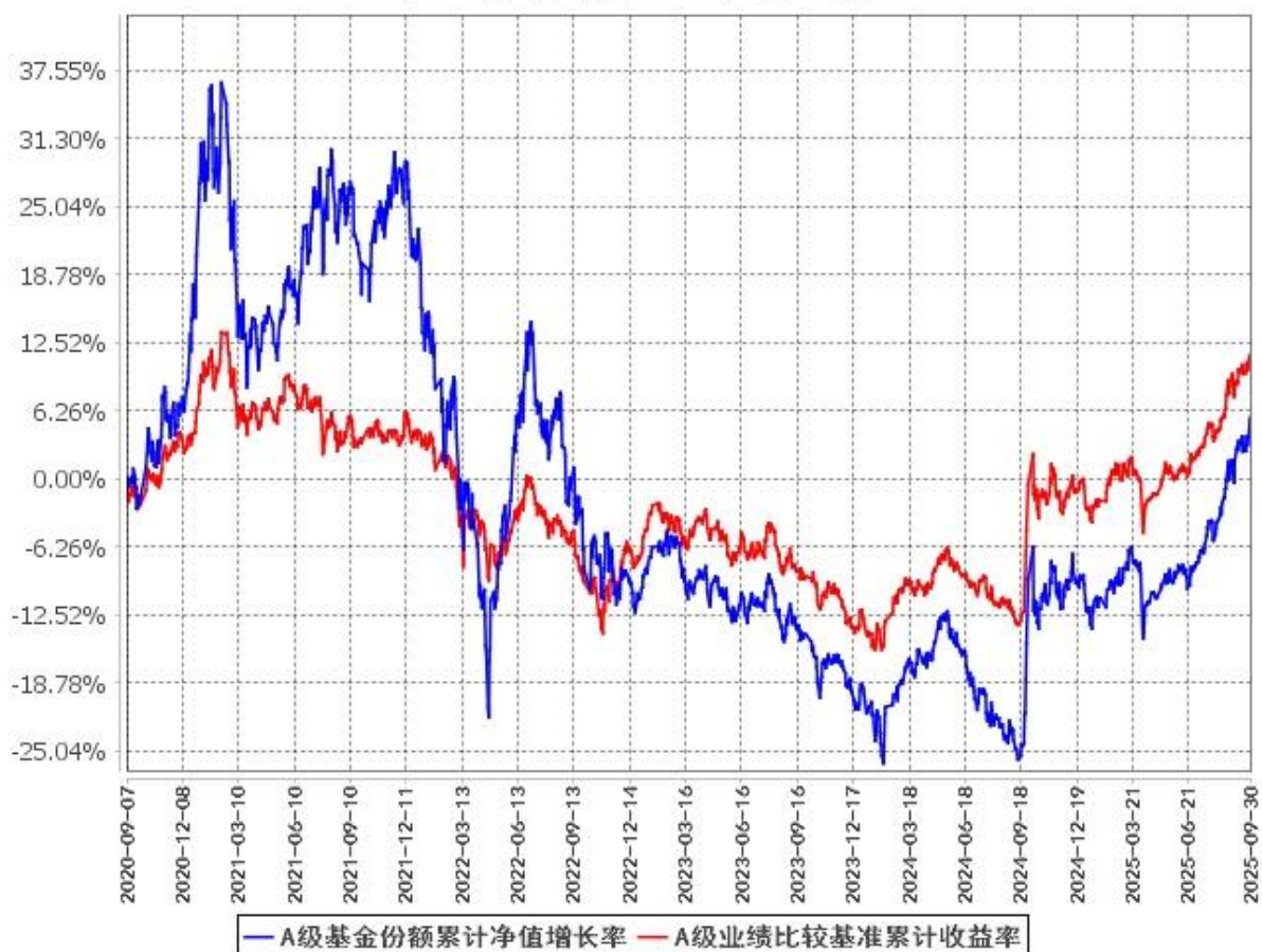
A级基金份额累计净值增长率与同期业绩比较基准收益率的历史走势对比图 (2020年9月7日至2025年9月30日)