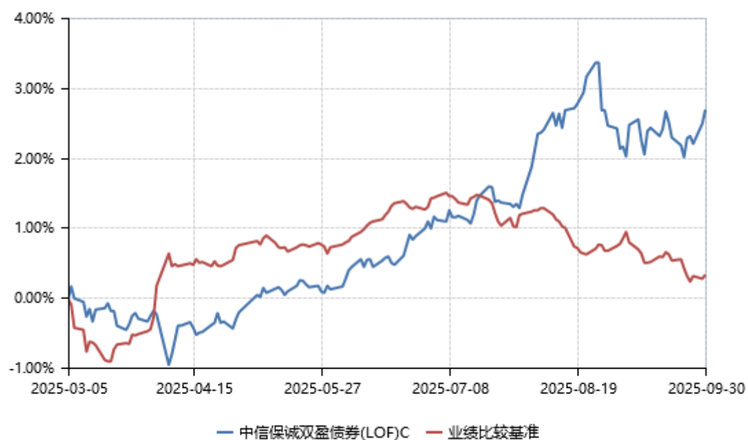
中信保诚双盈债券(LOF)D