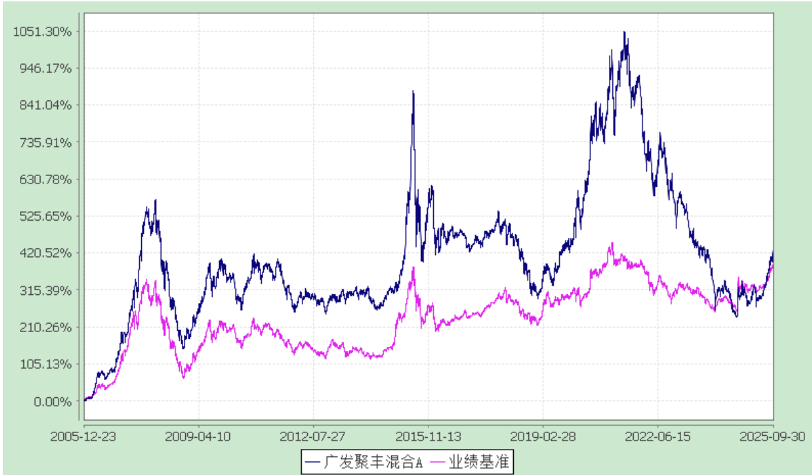
广发聚丰混合型证券投资基金 累计净值增长率与业绩比较基准收益率的历史走势对比图 (2005 年 12 月 23 日至 2025 年 9 月 30 日)