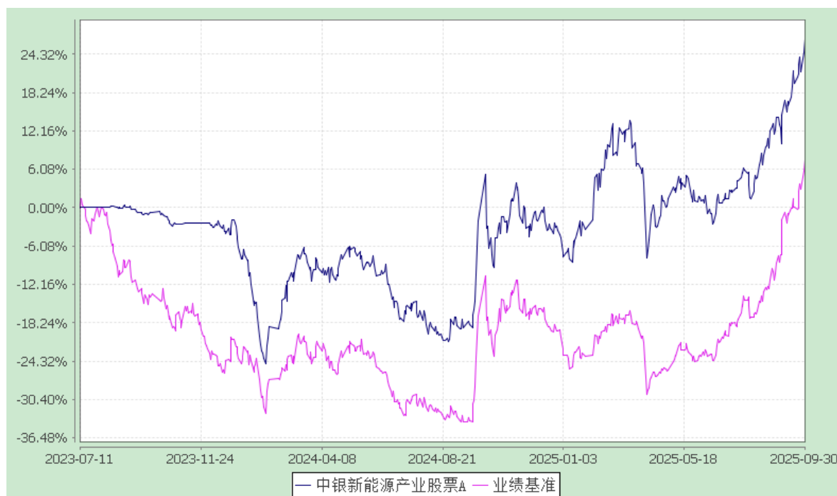
2. 中银新能源产业股票 C: