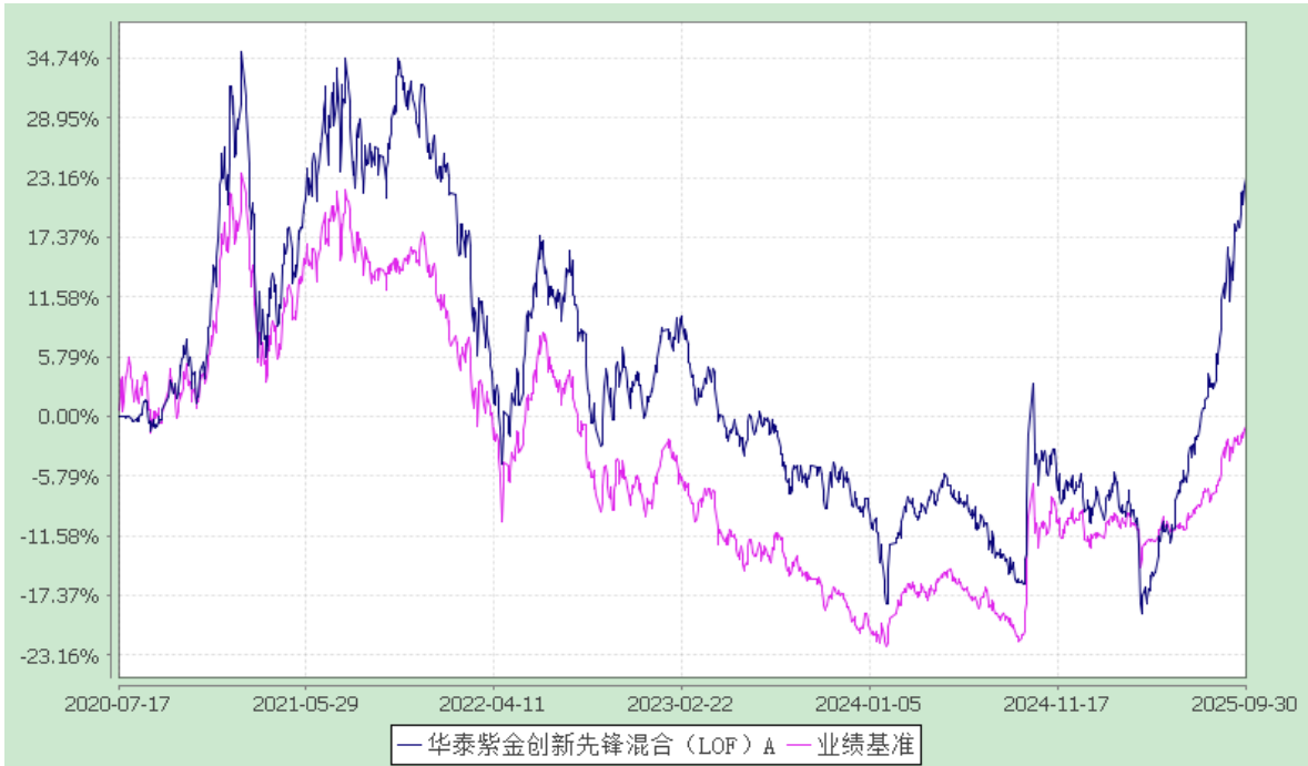
华泰紫金创新先锋混合型证券投资基金（LOF） 累计净值增长率与业绩比较基准收益率的历史走势对比图 (2020 年 7 月 17 日至 2025 年 9 月 30 日)