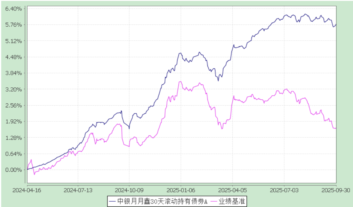
中银月月鑫 30 天滚动持有债券型证券投资基金 累计净值增长率与业绩比较基准收益率的历史走势对比图 (2024 年 4 月 16 日至 2025 年 9 月 30 日)